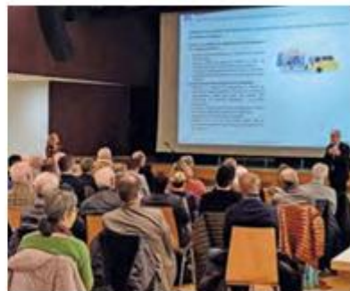
La réunion publique du 27 mars 2024 au Gabion, à Drusenheim.

À l'issue de la révision, notre SCoT vaudra Plan Climat pour le territoire de la Bande Rhénane Nord. Il sera l'un des premiers à intégrer les enjeux et objectifs climatiques et énergétiques.