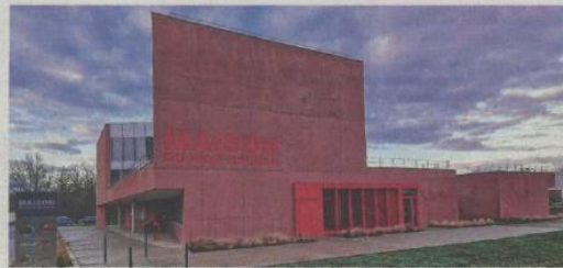
Le nouveau siège du PETR de la bande rhénane nord est établi dans la maison du Pays rhénan à Drusenheim.

Trois grands axes sont définis : le maintien du cadre de vie et le renforcement de l'attractivité du territoire, le soutien et la diversification du développement économique, et l'amélioration du cadre de vie. Dans ces axes, il s'agit notamment d'encourager la croissance démographique tout en régulant l'accueil et de fixer un objectif cohérent de construction de logements, économies foncières, et aux typologies variées. Un accent est également mis sur le développement des transports en commun et des alternatives à la voiture, et sur l'encouragement des relations transfrontalières.